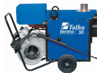
TALHU Termo 30