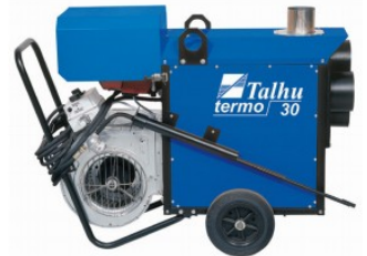
TALHU Termo 30